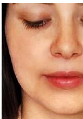
PRIMA DELL'APPLICAZIONE PELLE SEGNATA, CON MACCHIE ED IMPERFEZIONI

Con un dischetto di cotone applicare l'acqua termale gelificata (precedentemente posta in frigorifero per qualche ora) sul contorno occhi per circa 1 o 2 minuti. Il risultato sarà uno sguardo più riposato, luminoso e con una evidente riduzione di borse e occhiaie.