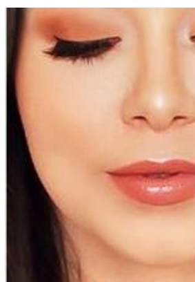
DOPO DELL'APPLICAZIONE PELLE LEVIGATA, UNIFORME, LUMINOSA